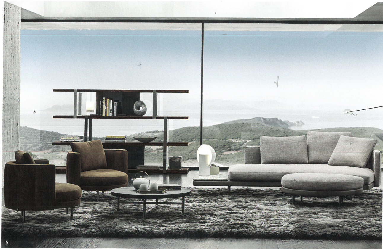
3/ Canapé Hélène en cuir et en hêtre massif, à partir de 6840 €. Duvivier Canapés. 4/ Canapé Wam en tissu et en métal, design Marco Zito, à partir de 2 497 €. Bross Italia. 5/ Canapé Torii en tissu, en cuir et en métal, design Nendo, prix sur demande. Minotti.