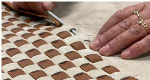
Brides de cuir tressées. Duvivier Canapés