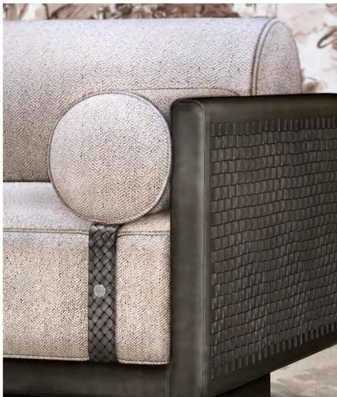
Canapé Elsa. Technique du tressage. Design Guillaume Hinfray. Duvivier Canapés

Showroom Duvivier Canapés – 27, rue Mazarine – 75006 Paris – www.duviviercanapes.com