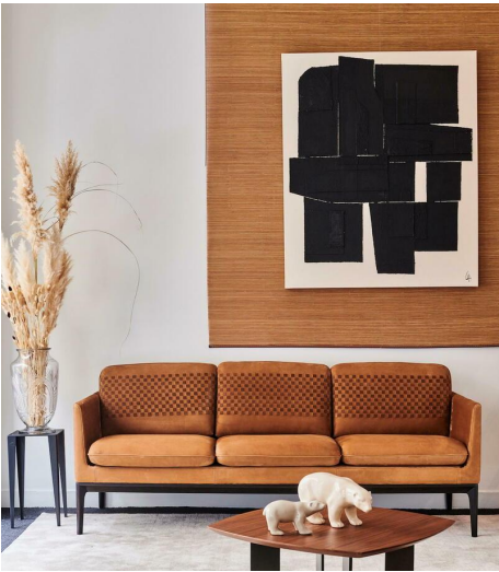
Canapé Allure.

taurillon d'une qualité exceptionnelle et développés exclusivement pour Duvivier, sont tous pleine fleur et jamais rectifiés, contrairement à l'usage dans l'automobile ou l'ameublement, où les cuirs sont poncés, réimprimés puis repigmentés. Ici, ils sont simplement plongés dans un bain de colorants (60 teintes), conservant ainsi leurs qualités thermorégulatrices : rafraichissants l'été, chaleureux l'hiver.