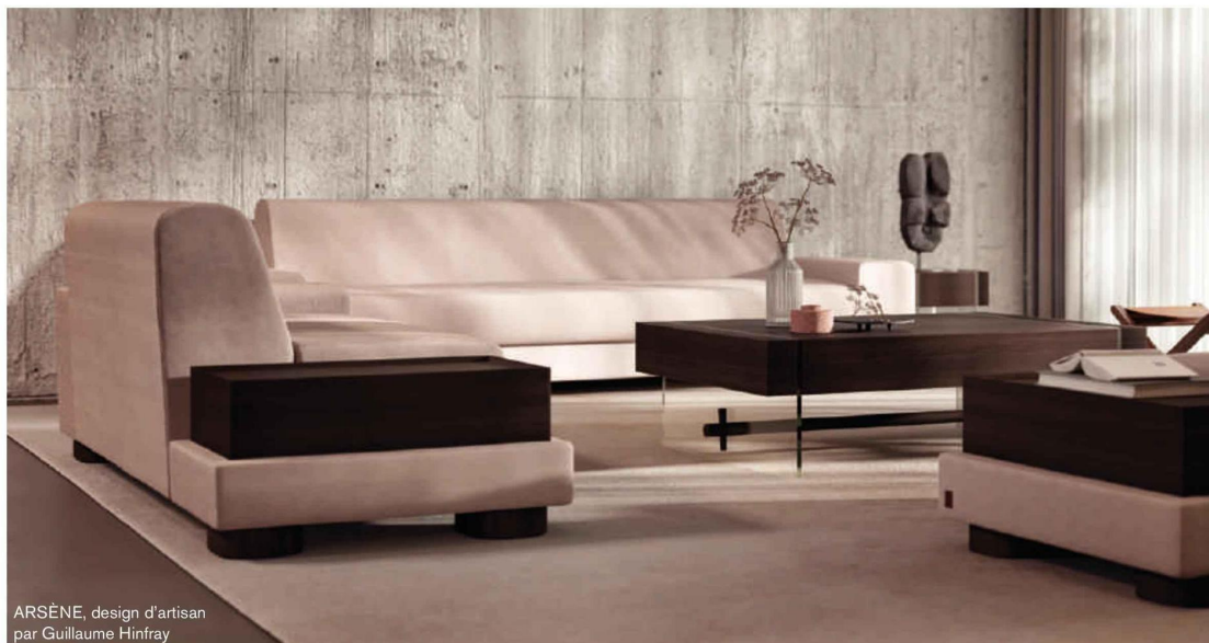
ARSÈNE, design d'artisan par Guillaume Hinfray

Le Cormier - 86350 Usson-Du-Poitou www.duviviercanapes.com